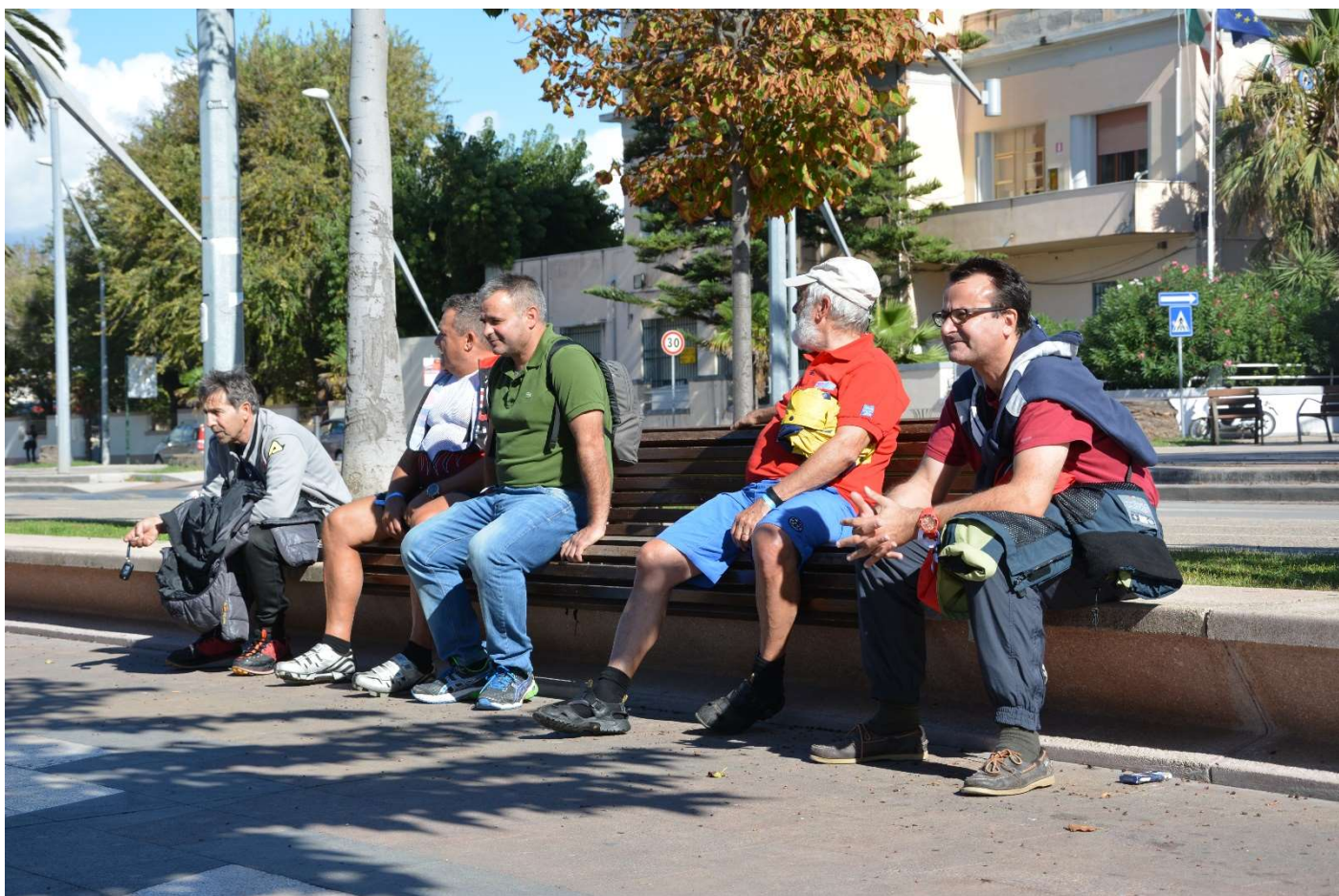
15/10/16 Alghero ..... Sosta in attesa di chi è al bar