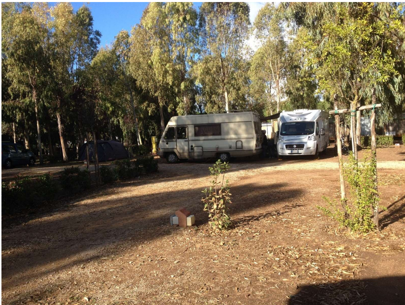
15/10/16 Fertia Camping Laguna Blu Accampamento