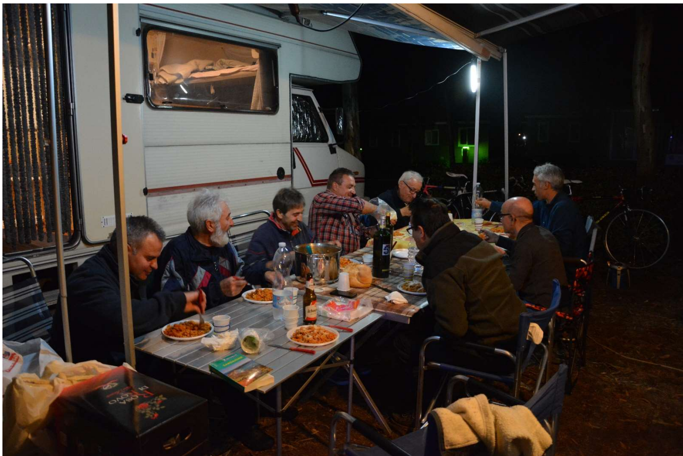
15/10/16 Fertia Camping Laguna Blu La prima cena all'aperto