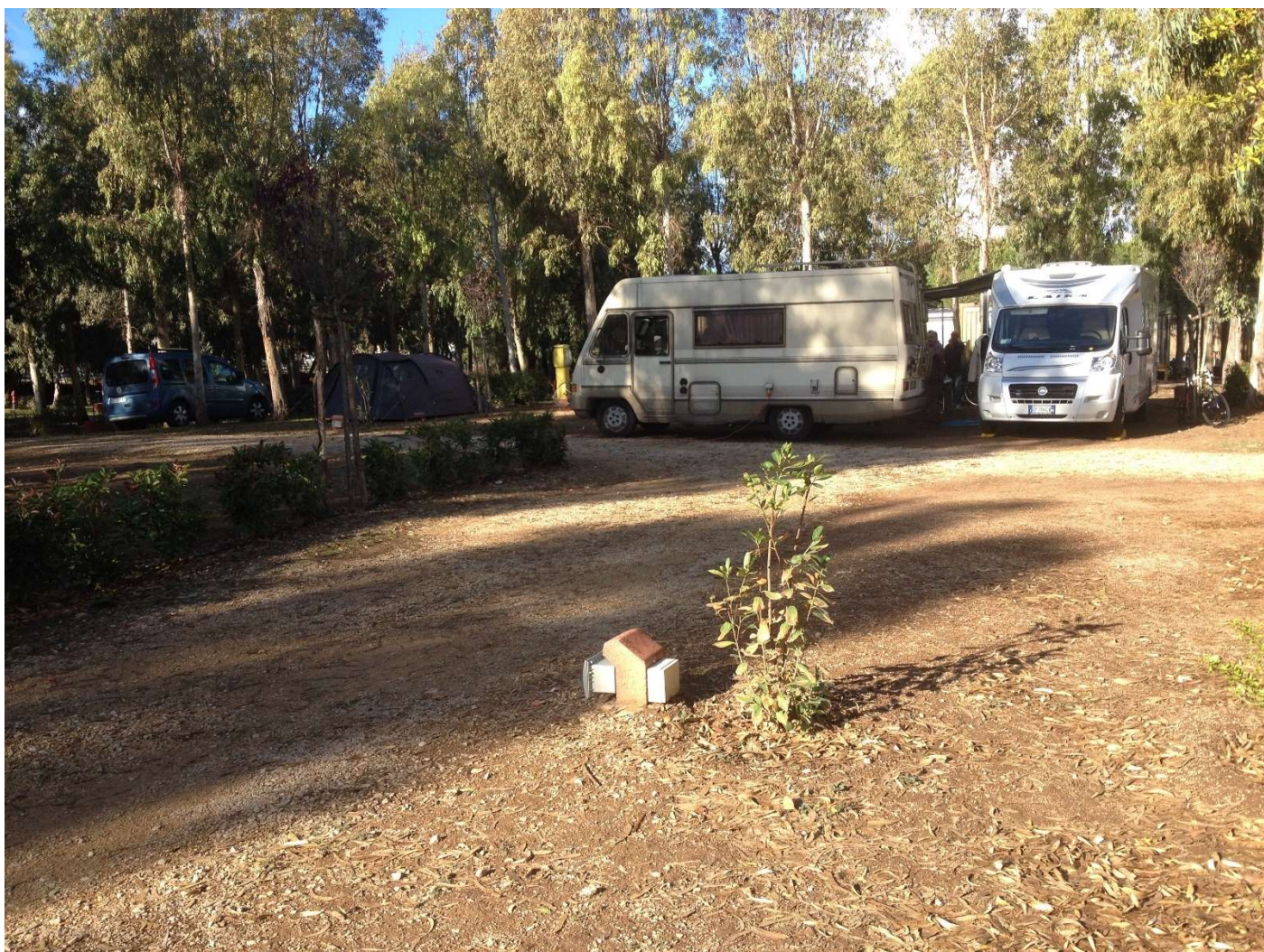
15/10/16 Fertia Camping Laguna Blu Accampamento