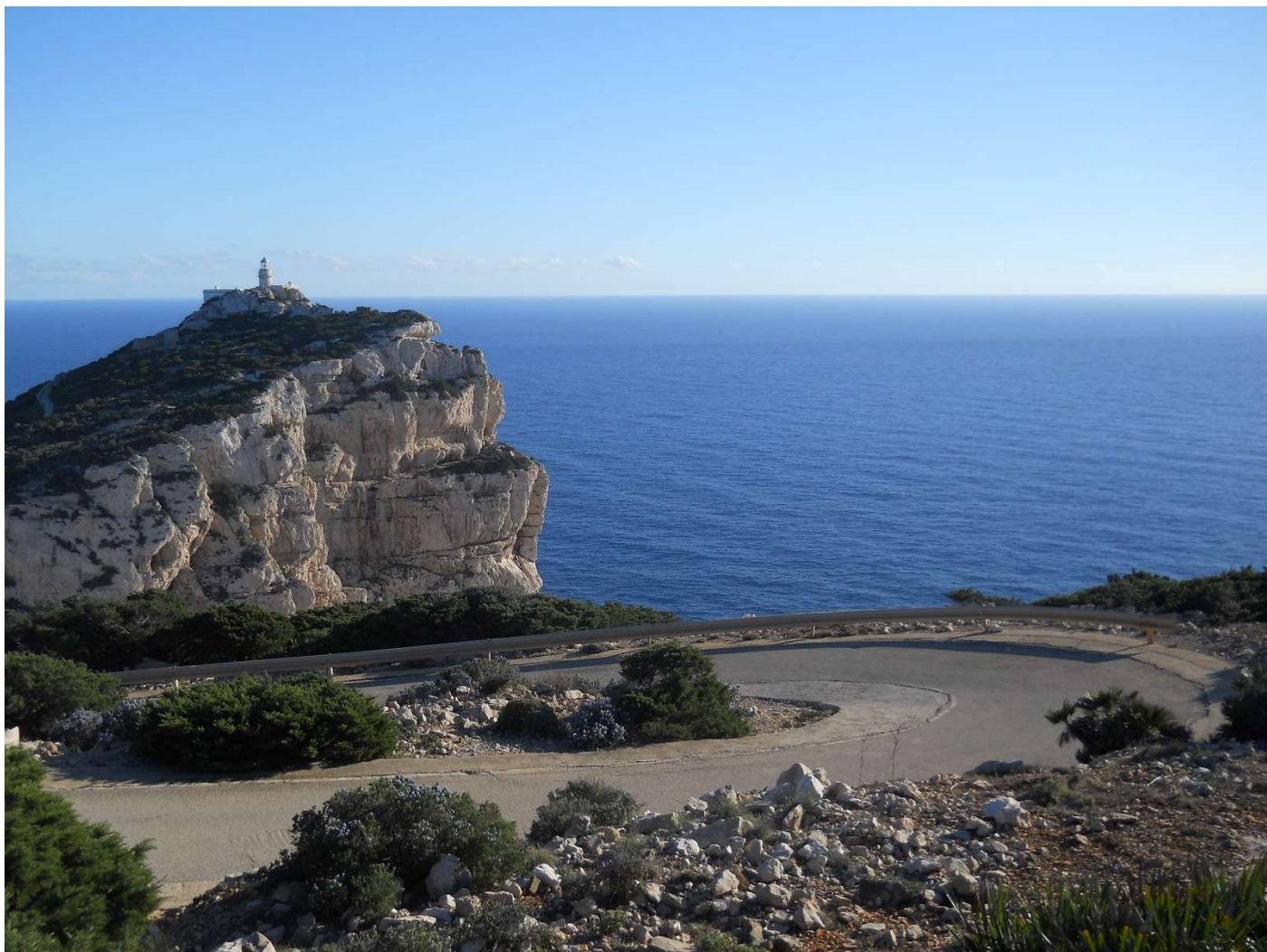
15/10/16 Zona Capo Caccia panorama dalla bici di Igor