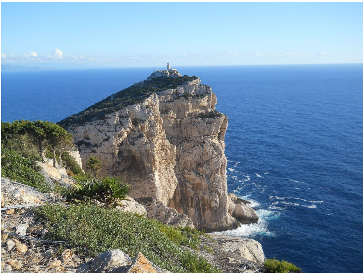
15/10/16 Zona Capo Caccia panorama dalla bici di Igor