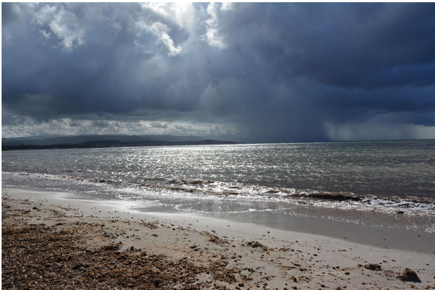
15/10/16 Fertilia Camping Laguna Blu il diluvio che bagnerà i coraggiosi ciclisti partiti per l'Alghero - Bosa