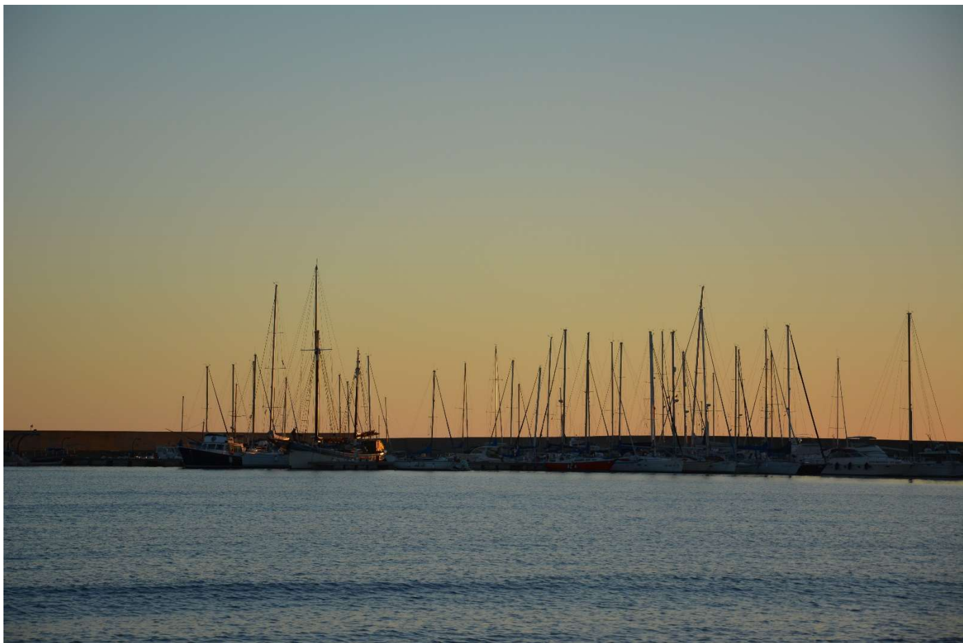
15/10/16 Alghero il porto