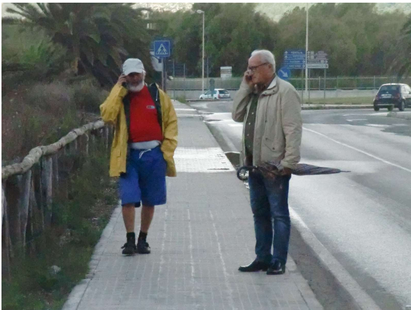
15/10/16 Fertilia sulla strada verso Alghero