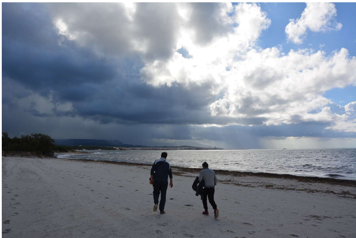
15/10/16 Fertilia Gilles e Gino in spiaggia verso Alghero sullo sfondo