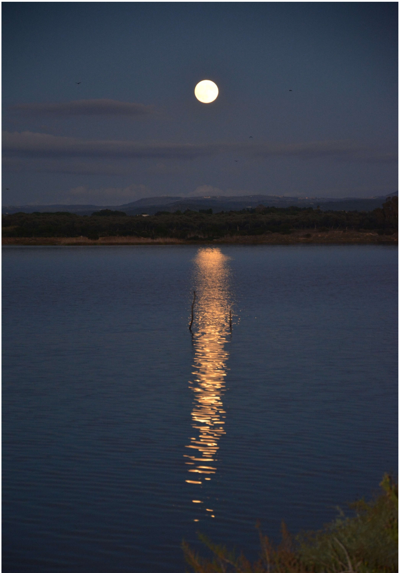
15/10/16 Fertia Camping Laguna Blu Luna sulla laguna