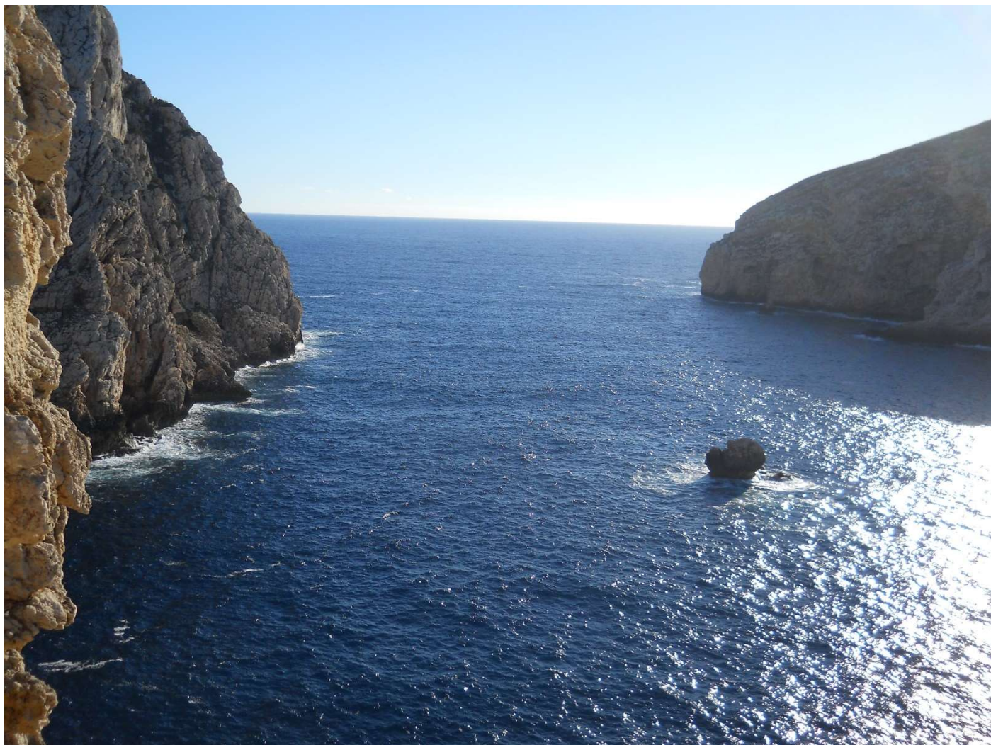
15/10/16 Zona Capo Caccia panorama dalla bici di Igor