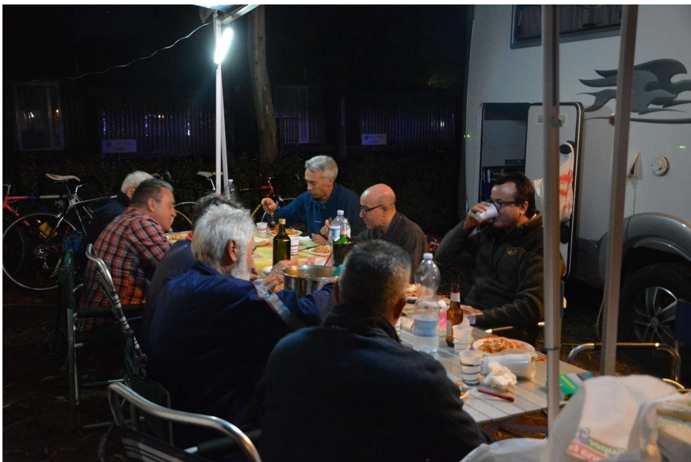
15/10/16 Fertilia Camping Laguna Blu La prima cena all'aperto