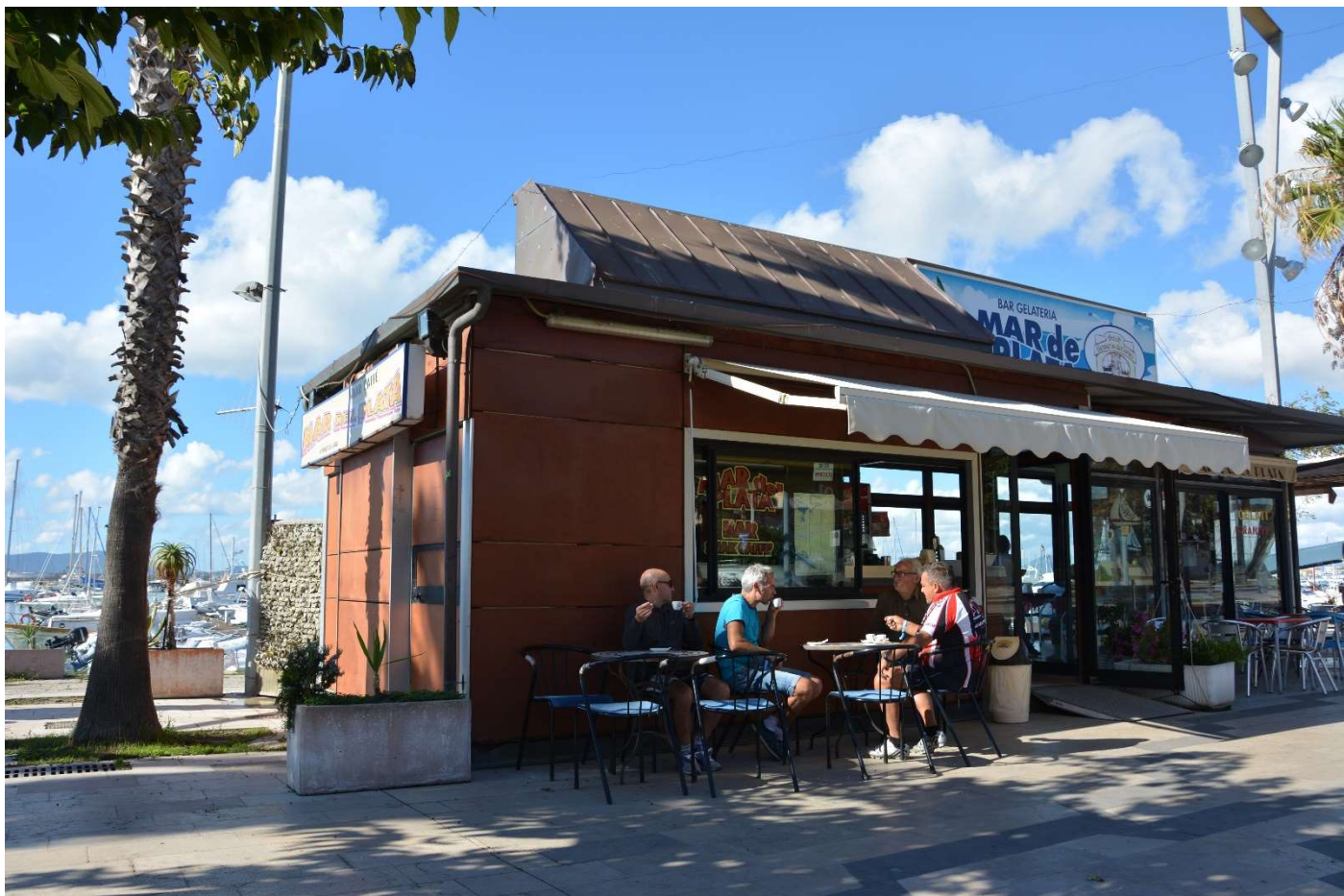
15/10/16 Alghero ..... Quelli che sono al bar