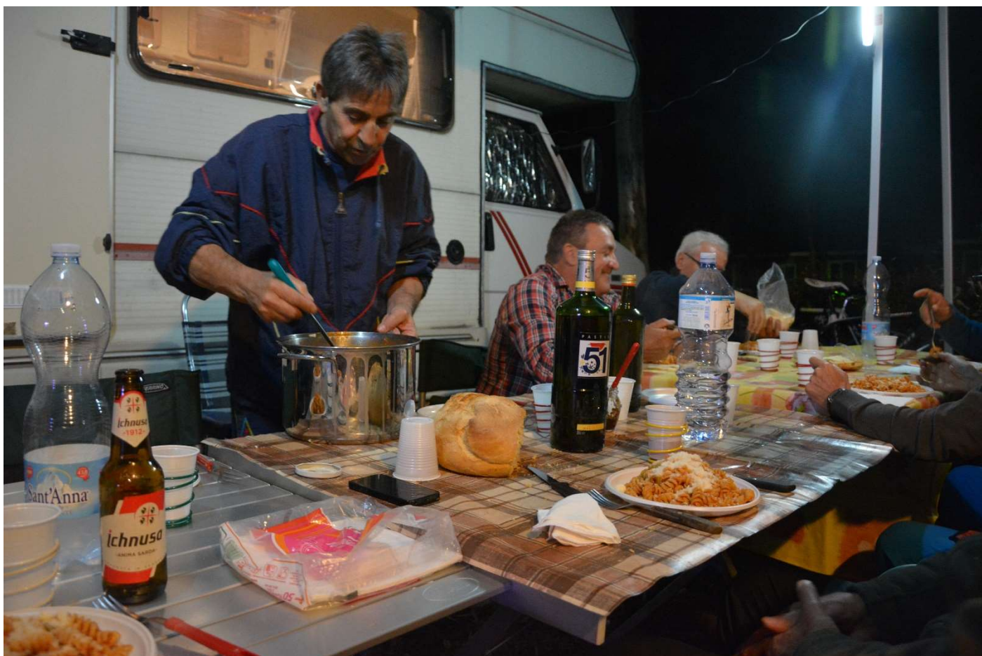
15/10/16 Fertia Camping Laguna Blu La prima cena all'aperto