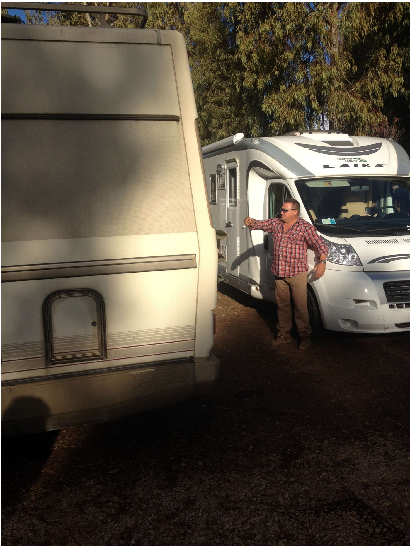
15/10/16 Fertia Camping Laguna blu Majur e le manovre per l'accampamento