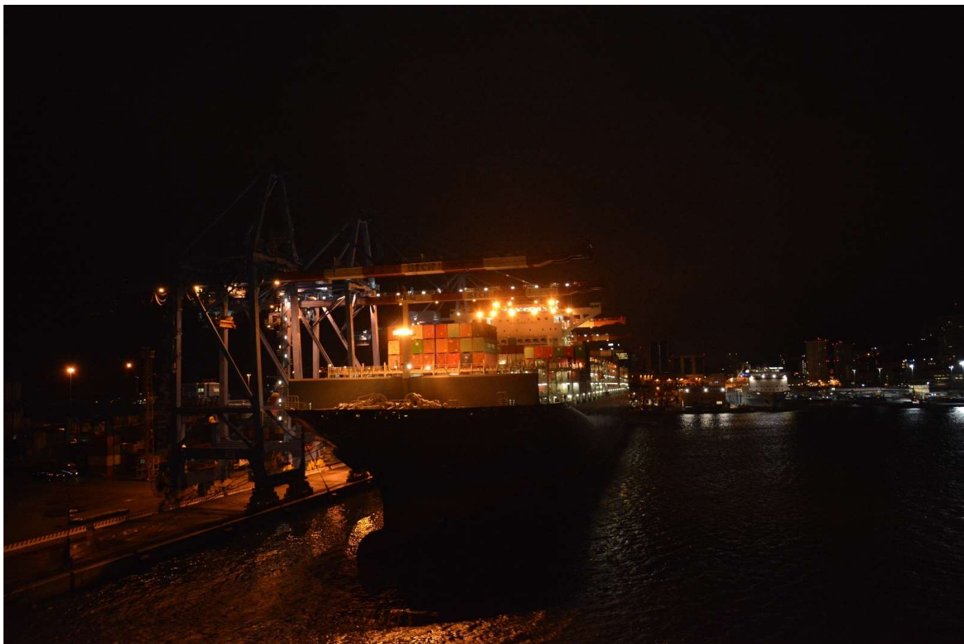
14/10/16 Lasciamo il porto di Genova. Destinazione Porto Torres