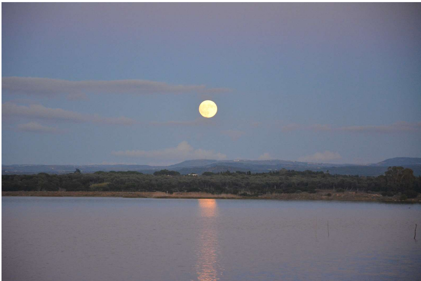
15/10/16 Fertia Camping Laguna Blu Luna sulla laguna